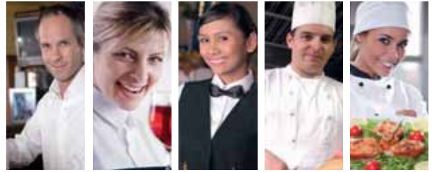
LAVABICCHIERI LAVASTOVIGLIE LAVAPIATTI LAVAGOGGETTI LAVASTOVIGLIE A TRAINO GLASSWASHER DISHWASHER GLASSWASHER WAREWASHER RACK CONVEYOR DISHWASHERS

Il successo dei nostri clienti passa anche attraverso la nostra esperienza e la qualità dei nostri prodotti. Le macchine Krupps sono pensate e progettate per i professionisti della ristorazione; tecnologia e funzionalità sempre all'avanguardia, ma anche particolare attenzione al rispetto dell'ambiente, all'efficienza e al risparmio. Krupps ti aiuta nel tuo lavoro quotidiano da più di due generazioni.