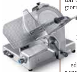
Galileo 350, Sirman

Iniziate preparando il pane: impastare in una planetaria tutti gli ingredienti, lasciando per ultimi il sale ed il burro, lavorando prima a bassa, poi ad alta velocità per formare “ la maglia “. Far prelievi tare, poi inserire in stampi da pan carrè, lasciando lievitare una seconda volta e cuocere in forno a 180 gradi per circa 50 min (chiaramente la cottura dipende anche dal tipo di forno che si utilizza). Lasciar riposare per un giorno. Tagliare con l'aiuto di una affettatrice delle fette molto sottili di pane che andremo ad oleare con dell'olio ai porcini (lasciando in infusione olio di oliva e porcini secchi) e condire con una polvere di porcini secchi. Infornare per alcuni minuti a 160 °C sino ad ottenere un bel colore dorato. Preservare due fette di pane per ogni commensale. Per il gelato andremo a mescolare il parmigiano con l'albume ed il latte in polvere, ci verseremo sopra il latte e la panna bollenti, quindi porteremo il tutto ad 85 °C, per poi congelare in un bicchiere da pacojet. A questo punto non ci resta che dressare il piatto, alternando una fetta di pane con della misticanza, un'altra fetta di pane, lamelle di porcini tagliate al momento e condite con pomodori confit, sale Maldon, zeste di limone in salamoia, scalogno ed erba cipollina. Terminare con una bella quenelle di gelato al parmigiano e servite.