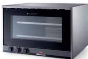
Monson Plus 4, Sirman