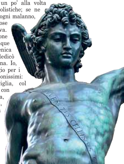
Perseo del Cellini