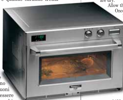
NE 3240, Panasonic

1400 Watts), the more magnetrons an oven has, the more evenly distributed the heat will be, and a gastronomic 1/1 sized oven lets us prepare quantities for much larger numbers of diners.