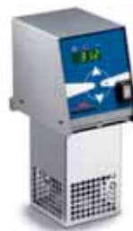
Per cottura sottovuoto a bassa temperatura Softcooker, Sirman