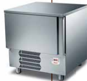
Abbattoire Cervino 5T, Sirman