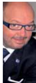
di Stefano Renzetti www.bar.it