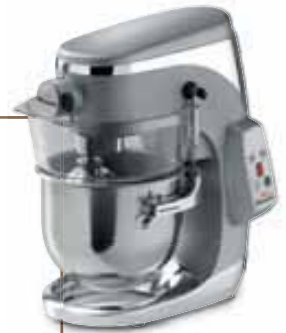
Planetaria Marte 5, Sirman

Come conservare i macaron: La corretta conservazione è determinante per mantenere intatte le caratteristiche di gusto e consistenza e quindi per garantirne il successo. Il macaron può essere conservato fino a 6 mesi se mantenuto a -21° C all'interno della scatola di confezionamento chiusa. Potrà essere invece conservato per 7 giorni in frigorifero a +4°C all'interno della scatola di confezionamento aperta oppure a temperatura ambiente all'interno della scatola di confezionamento aperta il 1° giorno e poi mantenuta chiusa.