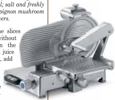
Mantegna 330, Sirman

Preparation: Place the fine slices of meat onto the plates without overlapping them. Season the meat slices with the lemon juice and olive oil very delicately, add salt and pepper. Clean the mushroom caps and slice them over the meat. Add the Parmesan cut with the slicer. The cultivated mushrooms can be replaced with sliced pore mushrooms or ovules.