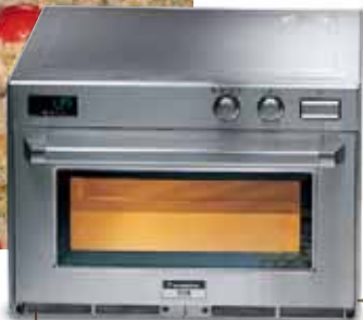
Microonde Panasonic NE 1840 - NE 2140 NE 3240

Decongelate il baccalà e dividetelo a pezzi di circa 80/100 g se decidete di farne un pezzo unico a porzione. A parte preparate delle foglie d'alloro, delle patate sbucciate che taglierete manualmente con un'altezza di circa 1 cm. Stendete le foglie d'alloro sul fondo della teglia e, sopra le foglie, le patate, una affianco all'altra fino a coprire l'intera teglia. Sopra le patate, uno a fianco all'altro, i filetti di baccalà che avrete condito a parte con pane, aglio, prezzemolo, sale e pepe e pochissimo olio d'oliva. Una volta completata la stratificazione di alloro, patate e baccalà, aggiungete acqua, olio d'oliva e vino bianco in uguale misura, fino a raggiungere i filetti di baccalà. Cuocete in forno statico per circa 45 minuti più altri 15 minuti per rosolarlo e rendere croccante il pane aromatico. Lasciate riposare. I liquidi dovranno risultare densi grazie al pane utilizzato e alle patate. Facoltativo per migliorarne l'aspetto cromatico l'utilizzo di pomodoro a pezzi. Sarà un piatto equilibrato nelle calorie e nel sapore adatto a piccoli e grandi, ad un costo accettabile per la ristorazione collettiva, ottimo per utilizzarlo nella linea Self dei secondi piatti.