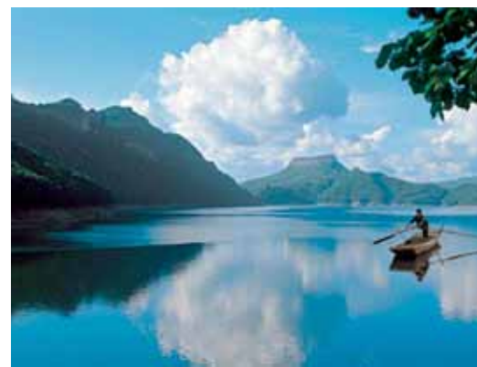
Provincia del Liaoning