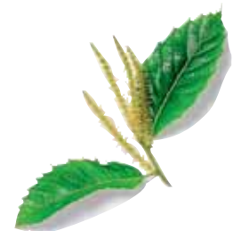
Foglie di castagno Chestnut leaves