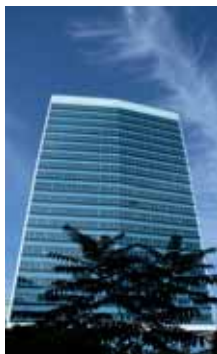
Da sopra: Palazzo dell'Accademia dell'Arte; una via della città vecchia; palazzo del Parlamento a Sarajevo.