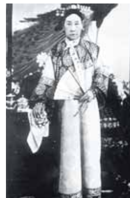
La famosa regina madre Cixi della dinastia Qing (1644-1911) The famous queen mother Cixi of the Qing dynasty (1644-1911)

Here then, is a typical Chinese recipe, where chestnuts perfectly accompany chicken.