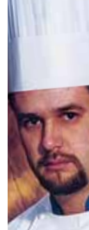
di Luigi Sartini