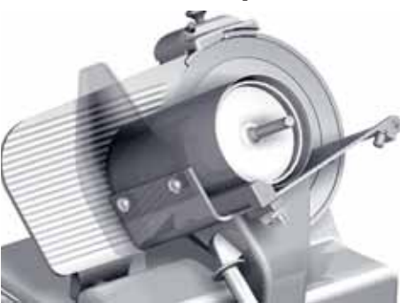
Affettatrice Galileo con tubo verdure, Sirman

N el nostro paese troviamo una grossa produzione di peperoni e melanzane nel sud Italia e, in special modo, in Sicilia dove si coltivano diverse varietà che poi giungono sui nostri mercati. Al momento dell'acquisto dobbiamo far molta attenzione alla loro freschezza controllando la buona consistenza, la buccia esterna liscia, lucente e senza grinze, con i piccioli ben saldi ed aderenti; in tal modo nella cella frigorifera potranno restare ancora tre o quattro giorni. Oggi si preferiscono i frutti con polpa carnosa e croccante, succosa e tenera. Il peperone può essere dolce o piccante, il primo è più utilizzato nelle varie preparazioni gastronomiche, mentre le varietà piccanti hanno nella bianca membrana interna la capsicina, un alcaloide che disturba soprattutto coloro che soffrono di ulcera o di problemi gastrici in generale. La melanzana, da parte sua, presenta spesso un sapore amaro per cui una volta tagliata si lascia sotto sale, o in acqua e sale, per alcuni