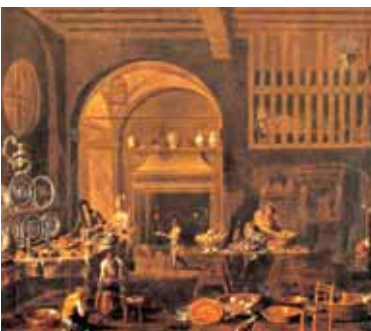
Alessandro Magnasco Preparativi per il pranzo. La cucina seicentesca