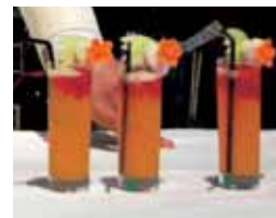
www.ristorantesporting.com Caorle (VE)