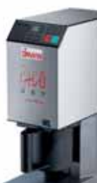
Luca alle prese con il Pacojet Luca is working with Pacojet