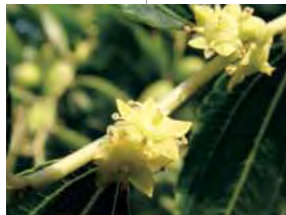
Colli Euganei, Padova Fiori di giuggiolo Euganei hills, Padova Jujube flowers