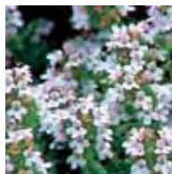
Timo vulgaris Thyme vulgaris