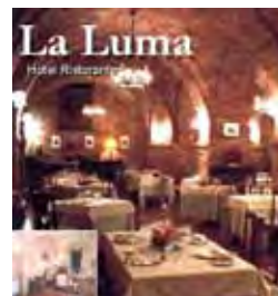
Ristorante La Luma, via G. Bruscantini, 1 Montecosaro (MC) tel. 0733.229701

The primary constituents of honey are fructose, glucose, water, other sugars and numerous other compounds, including organic acids, mineral salts and enzymes. Glucose provides immediately available energy, while fructose is metabolised in the liver and serves as an energy reserve. A hundred grams of honey contains approximately 320 calories, and honey is an extremely powerful sweetener. As it consists predominantly of simple sugars (glucose and fructose in varying proportions – this ratio is important as the higher the glucose content, the more likely the honey is to crystallise) honey is very easy to digest. Glucose enters the bloodstream directly and can therefore be used immediately, while fructose is consumed more slowly, providing longer lasting energy. Crystallisation is a natural process depending mainly on the composition of the honey and the temperature, occurring at varying temperatures below a maximum of around 14°C. The higher the glucose content, the faster the honey will crystallise, whereas very low temperatures inhibit crystallisation. The only honeys that remain liquid are acacia, chestnut and honeydew. In all other honeys, crystallisation is a natural phenomenon. To liquefy crystallised honey, simply warm in a bain-marie at no more than 40°C.