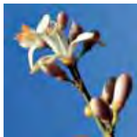
Fiore di limone Lemon flower