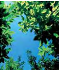
Castagno e miele di castagno Chestnut and chestnut honey

The dark amber chestnut honey, with its intense, pungent aroma and bitter aftertaste is the perfect accompaniment for the pigeon, which is slightly gamey with hints of liver.